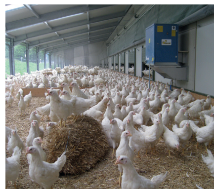
Poulette dans le jardin d'hiver.

Dans les élevages mixtes, les poulettes sont en outre pesées une fois par semaine à la main. Via notre système de rapport, nous obtenons des informations importantes sur la consommation de nourriture et d'eau, ainsi que sur le poids des animaux. Lors des visites de contrôle ayant lieu régulièrement, les résultats sont discutés et des adaptations ont lieu, le cas échéant.