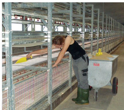
Premier nourrissage à la main.

La phase de démarrage est une étape importante et intense pour le développement des poussins. Plusieurs contrôles par jour sont essentiels pour garantir que tous les poussins mangent et disposent de suffisamment de nourriture et d'eau. Pendant l'élevage, les jeunes poulettes sont vaccinées via l'abreuvoir au total à cinq reprises, selon un calendrier fixe avec différents vaccins.